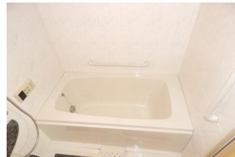
物件名 加羅コート草津壱番館302号室