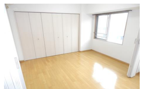
物件名 加羅コート草津壱番館302号室