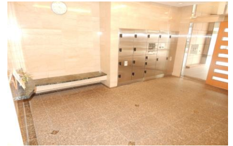
物件名 加羅コート草津壱番館302号室