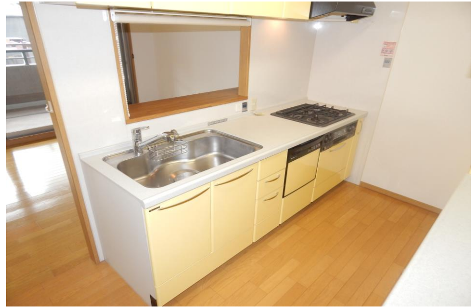
物件名 加羅コート草津壱番館302号室