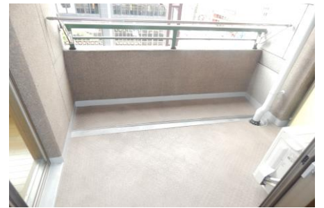
物件名 加羅コート草津壱番館302号室